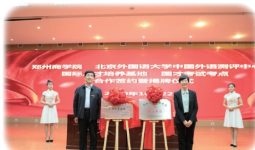
国才助力院校开展“访企拓岗促就业”活动