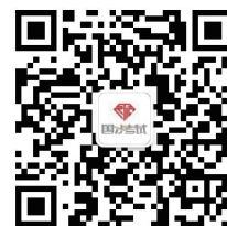
国才考试微信公众号