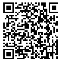
国才官网 “院校专区”